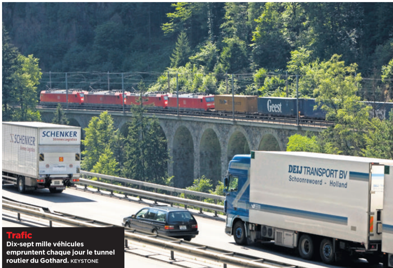
Trafic Dix-sept mille véhicules empruntent chaque jour le tunnel routier du Gothard.